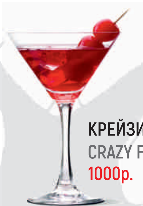
КРЕЙЗИ FOX / CRAZY FOX 1000р.